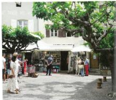
De par ses ruelles et ses placettes, ses jolies adresses et son art de vivre, le Castellet incarne le village provençal par excellence.

Derrière le volant se trouve l'écran 12,3" du système Multimédia et Navigation Premium, le volant trois branches garni de cuir et une horloge analogique avec éclairage LED.