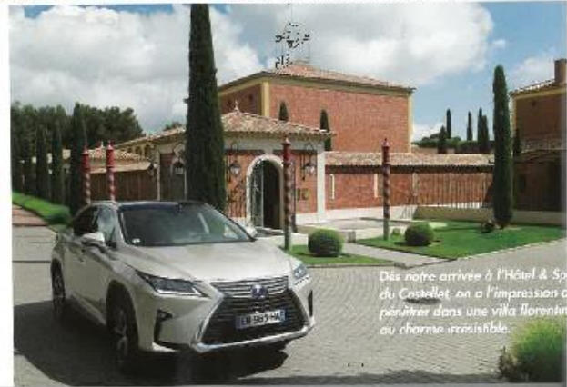
Dès notre arrivée à l'Hôtel & Spa du Castellet, on a l'impression de pénétrer dans une villa florentine au charme irrésistible.